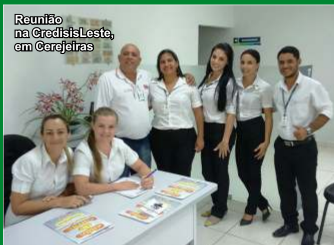
Reunião na CredisLeste, em Cerejeiras