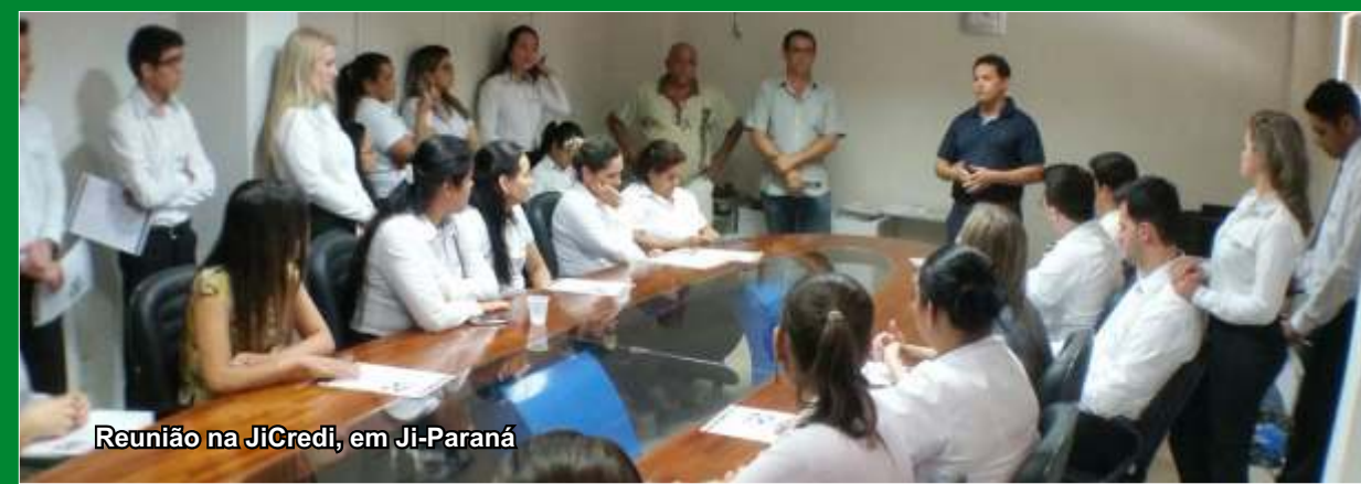
Reunião na JiCredi, em Ji-Paraná