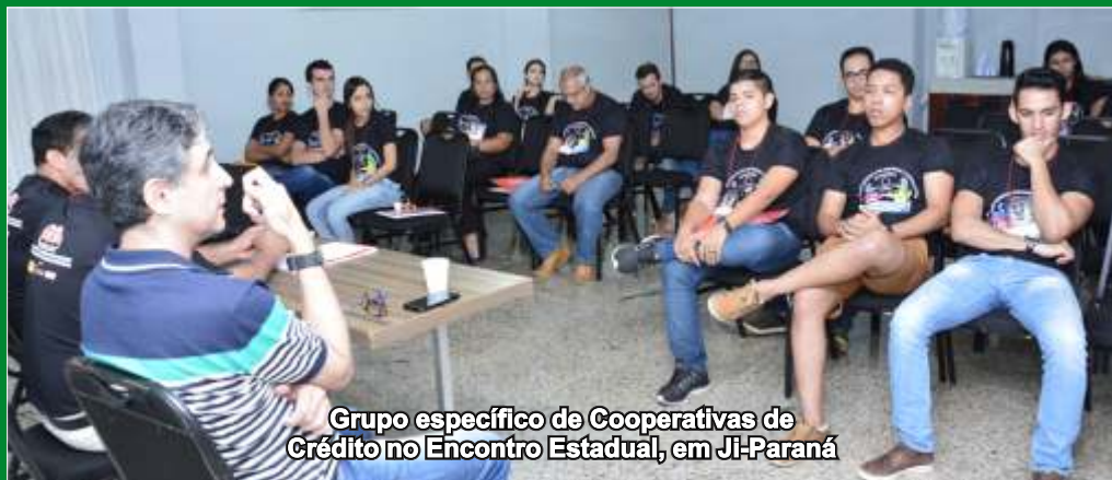
Grupo específico de Cooperativas de Crédito no Encontro Estadual, em Ji-Paraná