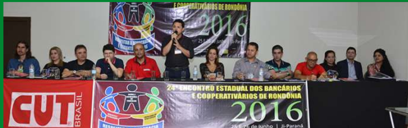
24º ENCONTRO ESTADUAL DOS BANCÁRIOS E COOPERATIVÁRIOS DE RONDÔNIA 2016 25 e 26 de junho | Ji-Paraná