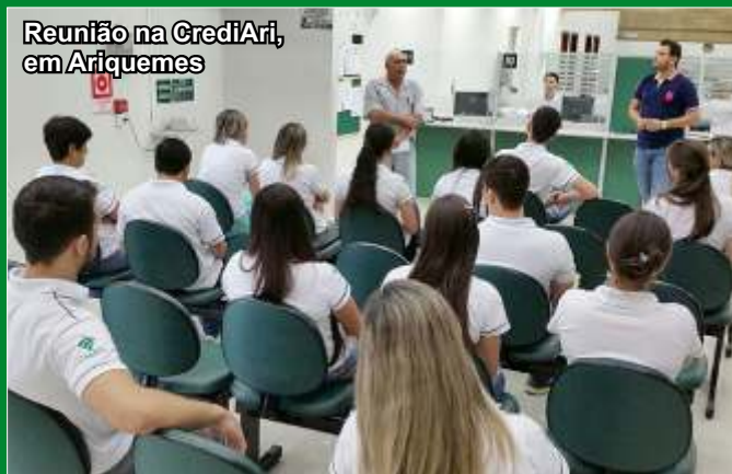
Reunião na CrediAri, em Ariquemes