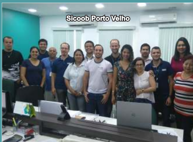
Sicoob Porto Velho