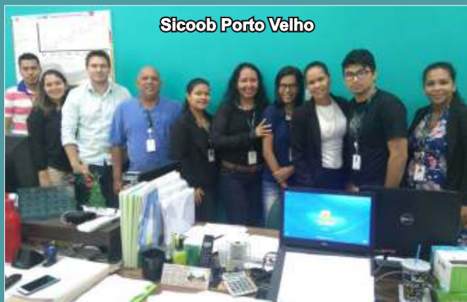
Sicoob Porto Velho